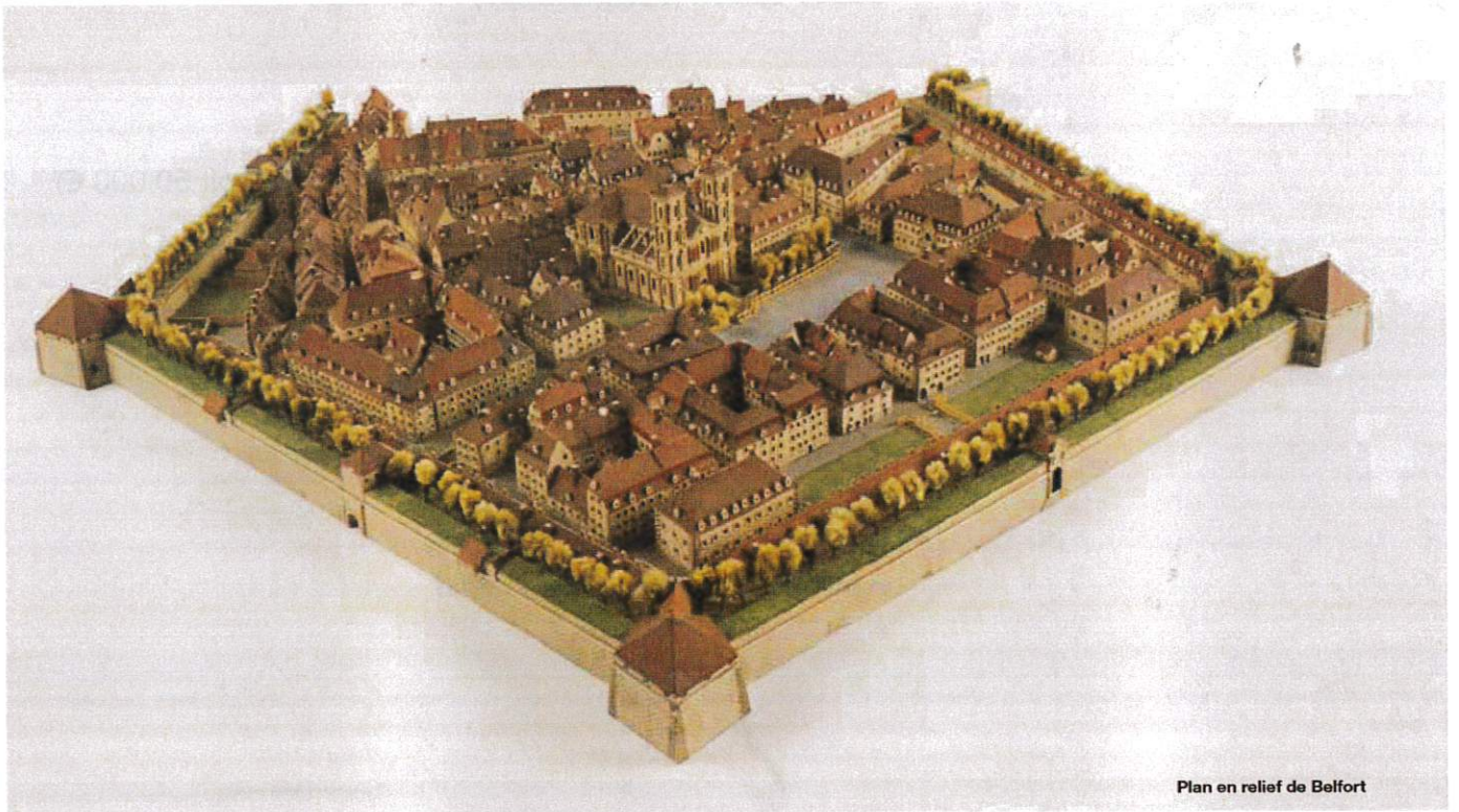
Plan en relief de Belfort

Belfort face à l'Allemagne. Belfort face aux Prussiens. Et le Lion de Belfort, place Denfert-Rochereau... C'est toute la mystique de la France républicaine après la défaite de 1870 qui s'exprime par le nom de cette ville. Elle a fait vibrer tous les patriotes de la Belle-Époque, c'est-à-dire à peu près la France entière, puisque les Français, toute opinion politique et classe sociale confondues, attendaient la revanche.