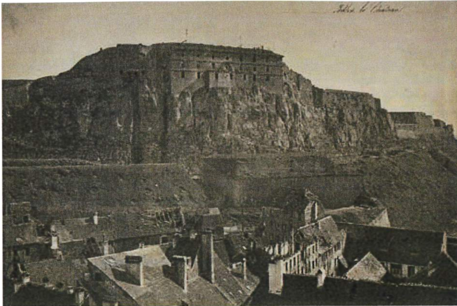
La façade de la Citadelle côté ville