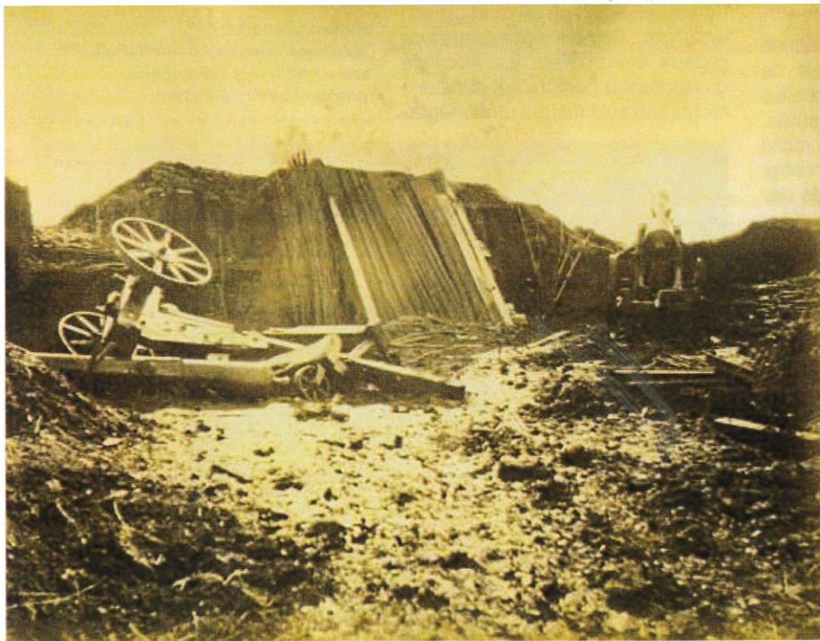
Ci-dessus : Batterie d'artillerie / Ci-dessous : Une batterie de la citadelle