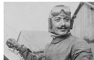
RDV au Musée d'Histoire Durée : 20 minutes

Qui n'a jamais rêvé dans son enfance de s'envoler ou de piloter un avion ? Au côté du capitaine Bird, venez découvrir l'univers des premiers chevaliers du ciel ! Avions d'époque, combats aériens, héros de l'aviation... Le capitaine Bird vous transporte dans le quotidien de ces hommes exceptionnels !