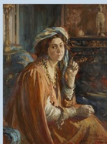
Jacques Émile Blanche, La Femme au turban , 1920, huile sur toile