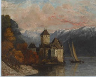
Gustave Courbet, Le château de Chillon , 1874, peinture à l'huile sur toile