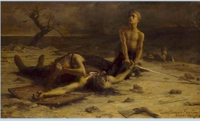
Louis-Édouard-Paul Fournier, Le fils du Gaulois , 1884, huile sur toile