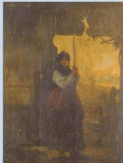
Gustave-Adolphe Jundt, La Résistance , après 1870, huile sur toile