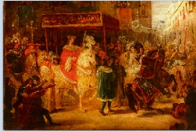
François-Joseph Helm, L'Entrée de Charles VIII à Naples , 1824, huile sur toile, étude en couleur