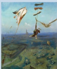
Gustave Doré, Entre ciel et terre , 1861, huile sur toile