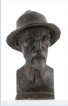
Aristide Maillol, Buste de Renoir , Non daté, zinc patiné